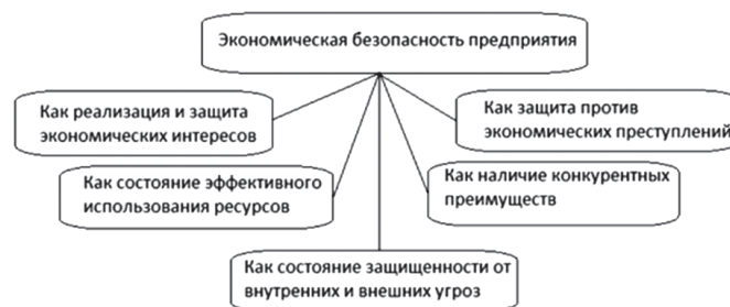
Рисунок 1. Ключевые аспекты экономической безопасности предприятия и их взаимосвязь с национальной безопасностью азербайджанской республики

гетической сфере, что делает их сотрудничество особенно важным для обеспечения стабильных поставок энергоресурсов и поддержки долгосрочного экономического роста. Следующим по значимости партнёром является Турция, которая получила 600 млн. долларов. Сотрудничество с Турцией сосредоточено на вопросах региональной стабильности и обороны, что особенно актуально для Южного Кавказа, где безопасность и стратегическое партнёрство играют важную роль [6, с.60]. Россия получила 500 млн. долларов инвестиций в рамках двустороннего военного сотрудничества. Взаимодействие с Россией включает в себя военные учения, соглашения по вооружению и другие инициативы, направленные на укрепление обороноспособности Азербайджана. Россия остаётся важным стратегическим партнёром в сфере безопасности для стран постсоветского пространства, включая Азербайджан. Инвестиции в НАТО составили 350 млн. долларов. Сотрудничество с НАТО направлено на улучшение оборонных способностей Азербайджана в рамках программы «Партнёрство ради мира». Несмотря на меньший объём инвестиций по сравнению с другими партнёрами, это взаимодействие играет важную роль в обеспечении долгосрочной стабильности и модернизации военной системы страны. Наконец, ООН получила 150 млн. долларов на миротворческие миссии и проекты, что свидетельствует о стремлении Азербайджана играть активную роль в международных усилиях по поддержанию мира [1, с.12].